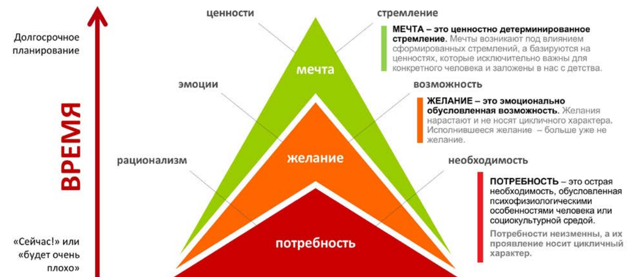
«Пирамида мотивации выбора» ©2004, 2006 Евгения Громова, Валерия Терентьева. Все права защищены. Не копировать без письменного разрешения.

Задача роста над собой, выхода на новый уровень и управления вовлеченностью — это работа с желаниями и мечтами. Надо найти, совместно выбрать желаемое будущее и отправиться туда, делая последовательные шаги.