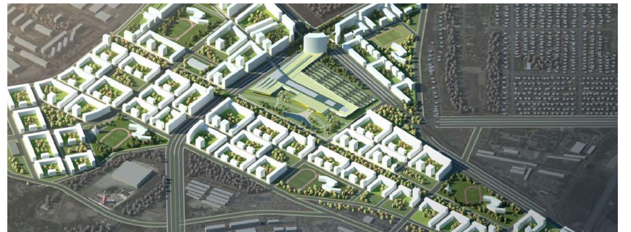
Эко-квартал «Русская Европа» в Калининграде