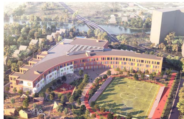
Школа/садик на 1100/220 мест в Коммунарке

Длительность и стоимость строительства любого сооружения, а также срок его жизни не позволяют регулярно перестраивать его по своему желанию или в попытках нагнать постоянно сменяющиеся нужды окружающего мира. Поэтому очень важно строить так, чтобы каждое пространство могло трансформироваться под различные сценарии использования. Здания и прилегающие к ним территории должны быть адаптивными, максимально функциональными. Например, холл школы или детского сада может быть не просто большим пространством с дверями, где много детей одновременно могут переобуться и отправиться на занятия. При наличии атриума и открытого амфитеатра, холл может стать зоной общения, пространством развития, местом для общих мероприятий.