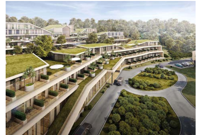
Гостиница в поселке Янтарный

Тяжелые и унылые коридоры офисов и больниц XX века уходят в прошлое, уступая место архитектурной терапии. Сегодня даже врачи ставят перед зодчими задачи создавать лечебные здания, в которых действительно приятно находиться. Вместо мыслей о долгом и трудном лечении, современные медицинские пространства формируют позитивный настрой, заряжают и высвобождают жизненную энергию, поддерживают человека в его стремлении быть здоровым. В помещениях, наполненных светом и воздухом, с элементами природной среды, чувствуешь себя совсем по-другому. В таких зданиях действительно стены помогают.