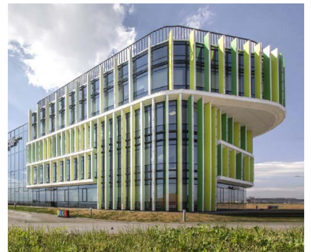
Медкластер в Сколково

Каменные джунгли из стекла и бетона, уничтожающие любые островки природы, не имеют будущего. В них много шума, процессов, движения, но все это искусственное, давящее, ненатуральное. Мы здесь словно нервные звери в не эргономичных зоопарках старого образца. Живая архитектура не противопоставляет себя природе. Она старается ненавязчиво дополнить ее, улучшить, сгладить экстремальные для человека условия. Или – наоборот, не тревожить, сохранить пейзаж в первозданном виде, раствориться в нем, неразличимо вписаться в рельеф. Архитектура становится естественным продолжением природы, призывая человека не бороться с мирозданием, но пребывать в гармонии с ним.