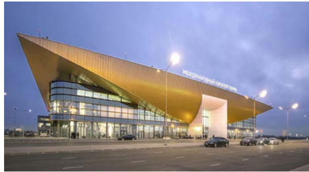
Аэропорт в Перми